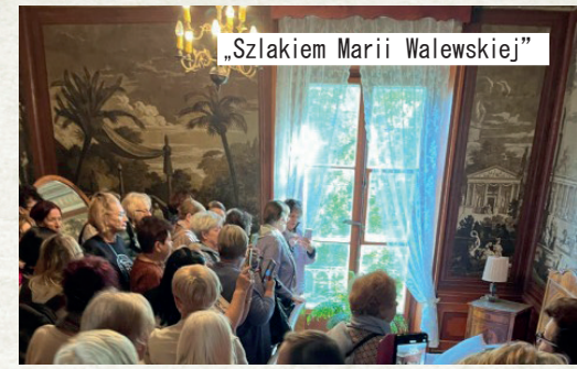
„Szlakiem Marii Walewskiej”