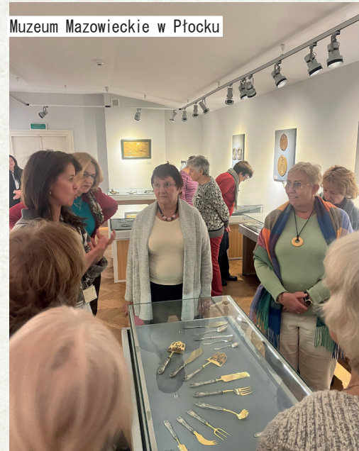
Muzeum Mazowieckie w Płocku