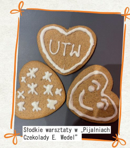
Słodkie warsztaty w „Pijalniach Czekolady E. Wedel”