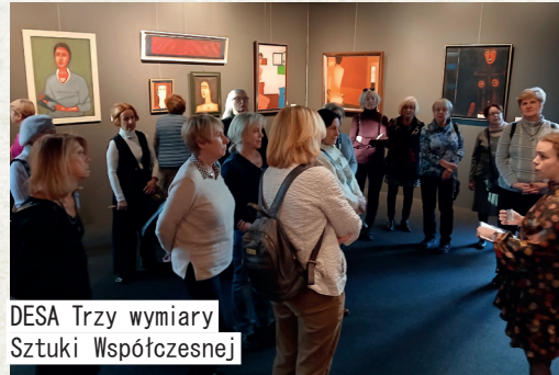
DESA Trzy wymiary Sztuki Współczesnej