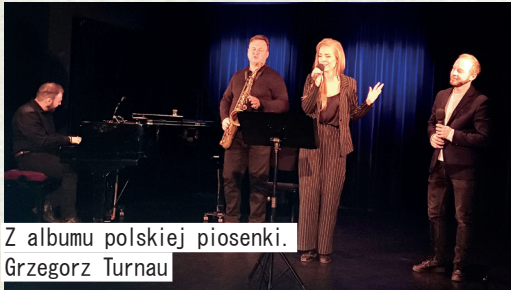
Z albumu polskiej piosenki. Grzegorz Turnau