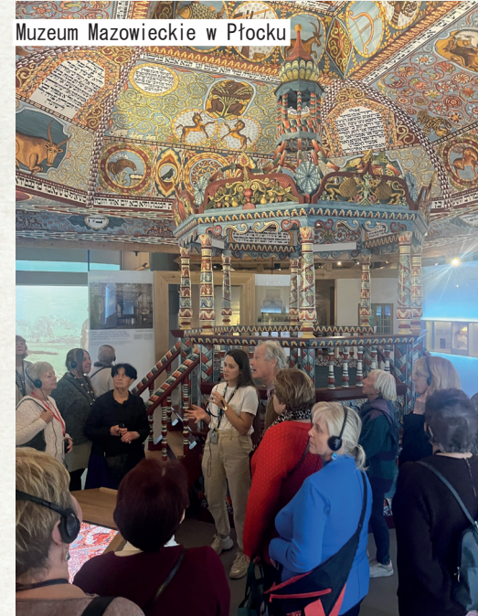
Muzeum Mazowieckie w Płocku