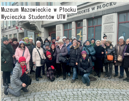
Muzeum Mazowieckie w Płocku Wycieczka Studentów UTW