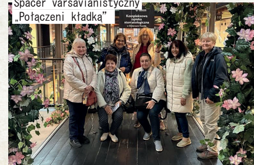
Spacer warszawianistyczny „Połączeni kładką”