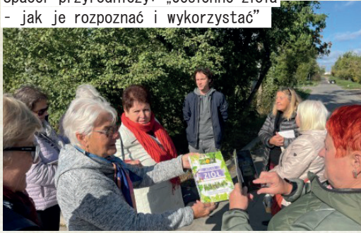
Spacer przyrodniczy: „Jesienne zioła - jak je rozpoznać i wykorzystać”