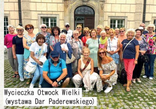
Wycieczka Otwock Wielki (wystawa Dar Paderewskiego)